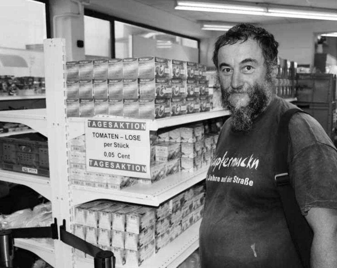
Viele Menschen sind auf Sozialmärkte und Tafeln angewiesen.