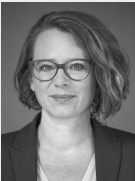
Mag.ª Eva Schobesberger Bildungsstadträtin

Das umfassende VHS-Angebot ist eine Einladung an alle Linzerinnen und Linzer, die vielseitige Welt des Wissens kennenzulernen und neue Erfahrungen zu machen.“