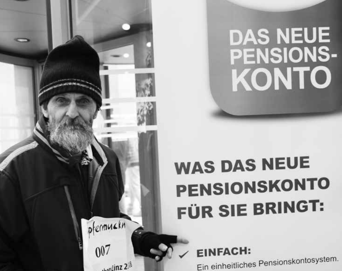
200.000 Österreicher sind von Altersarmut betroffen.

vorkommen, weil ich ja an dem ganzen Geschehen rundherum nicht teilhaben kann. Djurica (Pension)