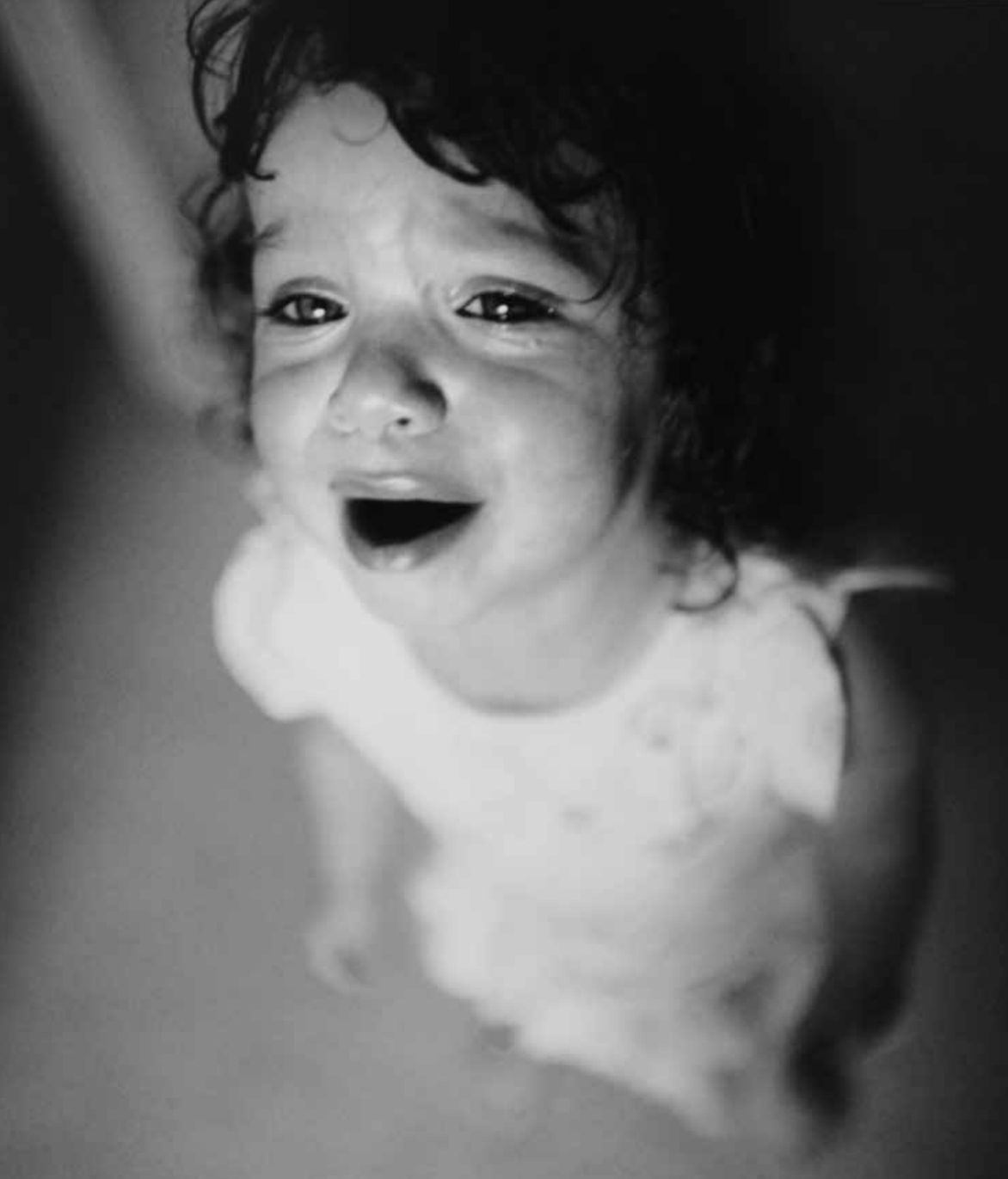
Bild Seite 3 und Bild oben: Ausstellung »Rabenmütter« im Kunstmuseum Lentos.

Wohl der Kinder sei, und man wolle diese auch nicht wieder aus ihrer gewohnten Umgebung reißen. Ich kann das verstehen, auch wenn es mir fast täglich das Herz bricht. Ich will ja, dass meine Kinder glücklich und zufrieden aufwachsen. Zum Glück ist das auch der Fall. Ich werde weiterhin nachts wach liegen und das Internet nach Fotos und Beiträgen über meine Töchter durchforsten und diese mit Stolz und Freude lesen. Ich hoffe, sie werden irgendwann die Entscheidung, die ich damals für sie getroffen habe, verstehen. Daniela (Steyr)