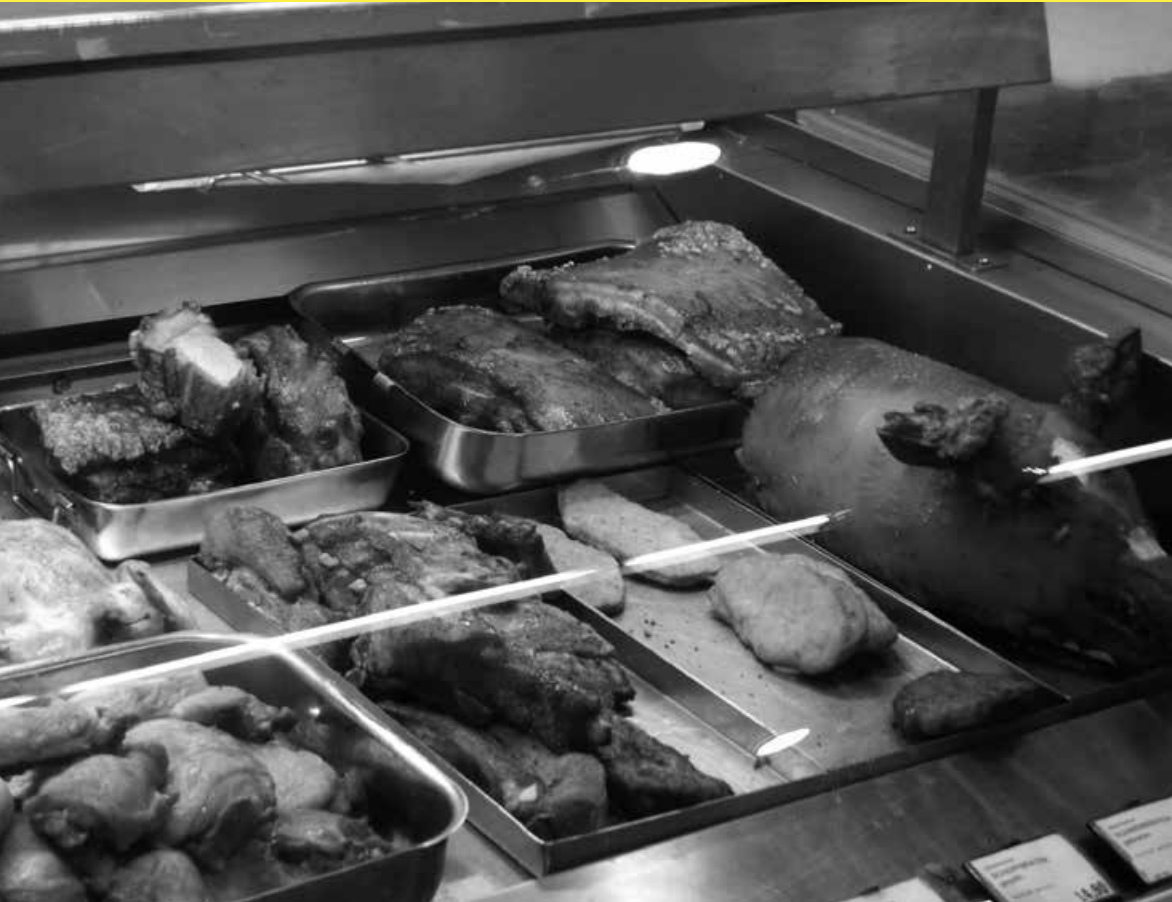
Eine Heißhungerattacke mit 30.000 Kalorien, das heißt in etwa 150 Krapfen, 10kg Pommes, zwei ganze Spanferkel oder 60 Wiener Schnitzel; das entspricht jeweils dem 12-Fachen des durchschnittlichen Tagesverbrauchs.