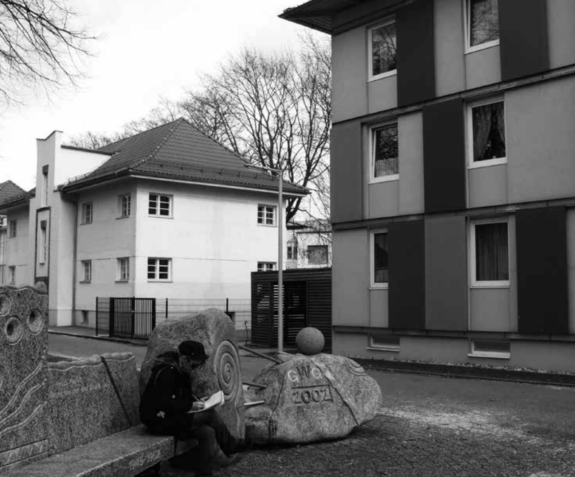
links ein renovierter Pionierbau des sozialen Wohnbaus aus der Vorkriegszeit, rechts ein Neubau der GWG in der Ernst-Koref-Siedlung im Franckviertel